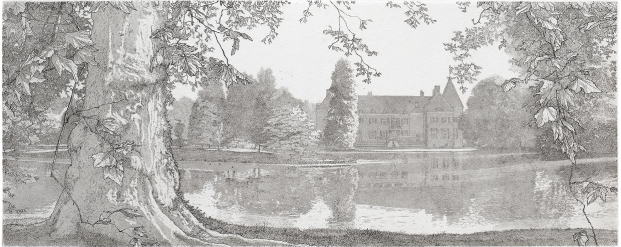
'Eerste ochtendlicht, kasteel Twickel, Delden'

Gedurende deze zomer ligt de focus voornamelijk op ons eigen werk.